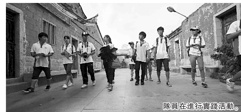
隊員在進行實踐活動。

記者在南滬村的長順古民居見到了華僑大學的學生們。太陽下,他們有的拿着相機在拍攝,有的在紙上或畫或寫。“我們上午從泉港出發,11