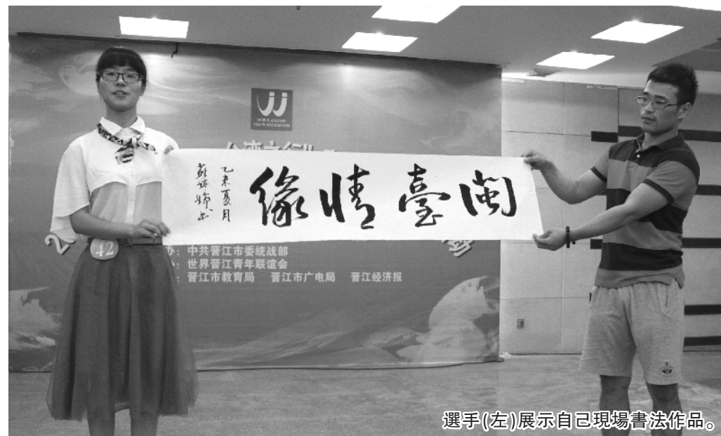
選手(左)展示自己現場書法作品。